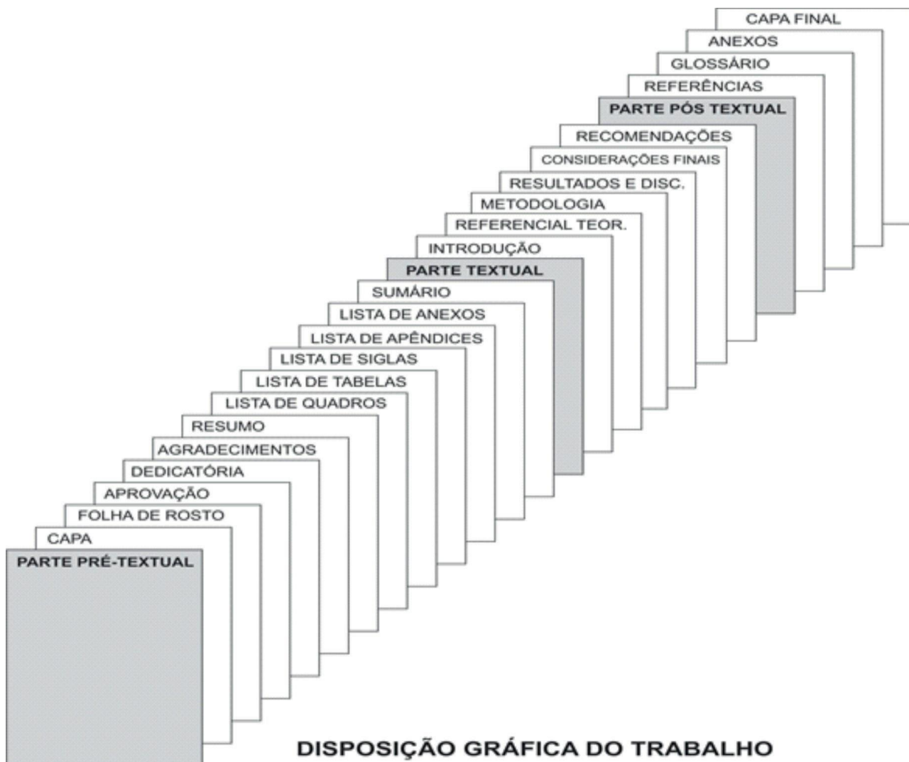
Figura 5 - Disposição gráfica do trabalho

No Manual do TCC da Urcamp, (2016, p. 56),