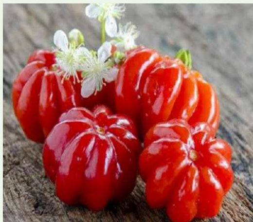
Eugenia uniflora L.