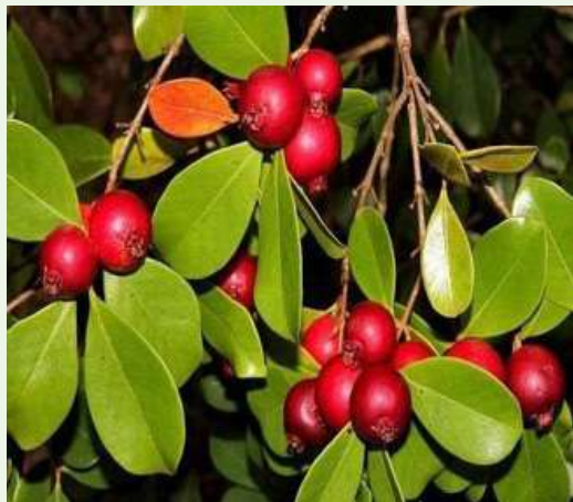
Psidium cattleianum Sabine.