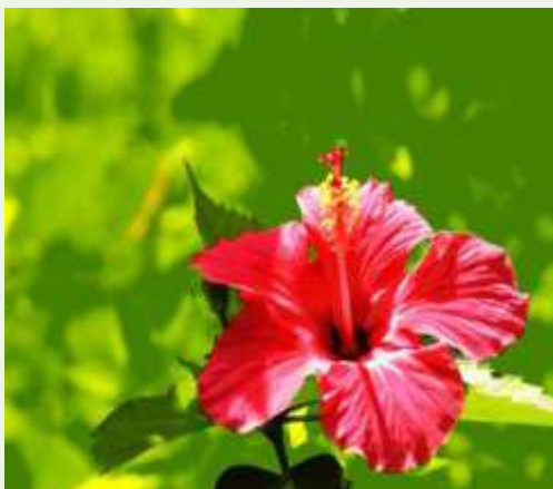
Hibiscus rosa-sinensis L.