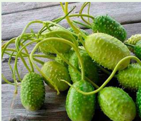
Cucumis anguria L.