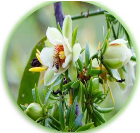
Pereskia aculeata Mill.