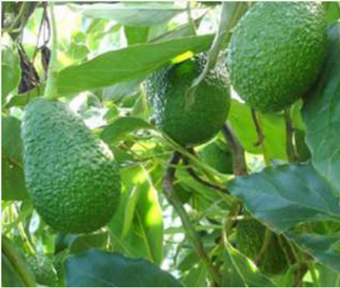
Persea americana Mill.