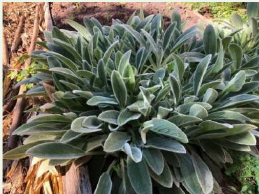
Stachys byzantina K.