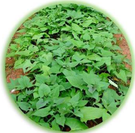
Ipomea batatas L.