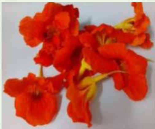
Tropaeolum majus L.